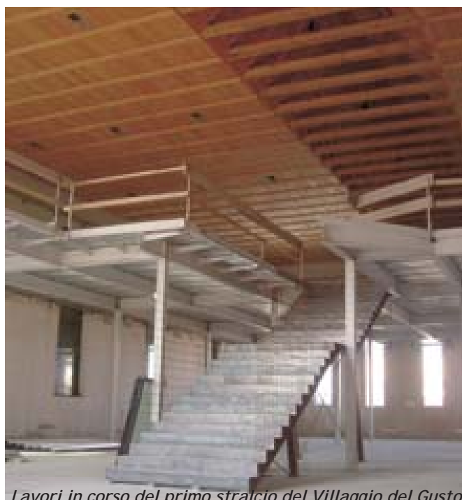
Lavori in corso del primo stralcio del Villaggio del Gusto

"Villaggio del Gusto", dove i soci potranno vedere i recenti sviluppi dei lavori di costruzione dell'ultimo rilevante progetto in cantiere. Per celebrare 35 anni insieme, ma, soprattutto, per avere sempre lo sguardo rivolto al futuro.