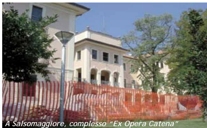
A Salsomaggiore, complesso "Ex Opera Catena"

di 6 appartamenti, il cui progetto è già visibile e valutabile dai soci.