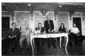
La sigla dell'accordo, ieri al Ridotto del Magnani.

I due comuni si impegnano ad intraprendere iniziative congiunte per creare e sviluppare reti fra i territori, concepire e organizzare eventi, avviare programmi di cooperazione istituzionale, promuovere un approccio etico e solidale an-