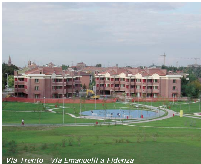
Via Trento - Via Emanuelli a Fidenza

E' ormai giunta a conclusione la realizzazione, da parte della cooperativa Casa del lavoratore, dell'intervento di Via Trento - Via Emanuelli a Fidenza (30 alloggi e due grandi spazi per uffici); il parco pubblico è già stato inaugurato nella primavera scorsa, nel corso del mese di ottobre verranno consegnati ai soci gli appartamenti già assegnati.