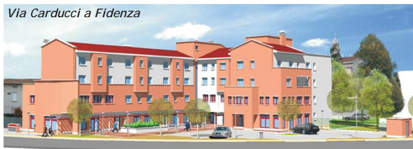
Via Carducci a Fidenza

La Di Vittorio, avendo ottenuto il relativo contributo finanziario regionale, ha in programma la costruzione di altri 16 appartamenti nella zona di Via Vespucci , sempre a Fidenza. Alloggi destinati all'affitto permanente e che, essendo in fase di progettazione, devono vedere l'inizio dei lavori entro il prossimo dicembre. Altri 10 alloggi per coppie di giovani, sempre in Via Iscaro a Fidenza, stanno aspettando, per poter vedere il via, di avere la conferma statale del finanziamento già assegnato dalla Regione; appartamenti da assegnare a prezzo convenzionato (quindi contenuto) e col contributo a fondo perduto per i giovani.