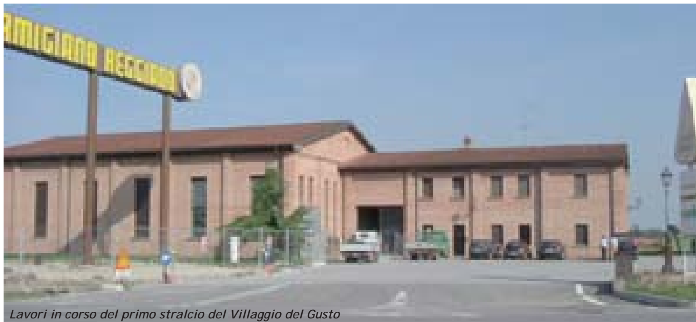
Lavori in corso del primo stralcio del Villaggio del Gusto

L'appuntamento è per sabato 8 ottobre alle ore 11.00, con il brindisi accompagnato da un buffet offerto dal Gruppo ai presenti. Il buffet è preparato da cuochi ed operatori della struttura ristorativa e commerciale in fase di realizzazione al "Villaggio del Gusto". L'incontro avrà luogo presso la sede dell'Agrinascente, via San Michele Campagna 22/d - Fidenza, nei luoghi del nascente