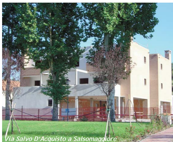
Via Salvo D'Acquisto a Salsomaggiore

previste in Via Salvo D'Acquisto , nel complesso "Ex Metal Ducati". Si tratta di 7 appartamenti, la maggior parte dei quali già assegnati.