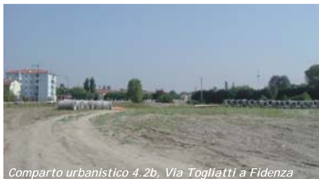
Comparto urbanistico 4.2b, Via Togliatti a Fidenza

Lì vicino, nel comparto urbanistico 4.2b, lungo la parte sud-est di Via Togliatti a Fidenza, da parte delle cooperative Casa del lavoratore e G. Di Vittorio, sono in corso i lavori di urbanizzazione del nuovo quartiere che lì sorgerà. Le nostre cooperative rappresentano solo una piccola percentuale dell'intera superficie della "lottizzazione", tuttavia, dopo le opere di urbanizzazione, realizzeranno interventi significativi. In particolare, la Di Vittorio inizierà a costruire, entro i primi giorni del prossimo dicembre, 16 alloggi per l'affitto, il grande valore sociale dei quali è giusto continuare con forza a ribadire. Nello stesso intervento, la Casa del lavoratore, gradualmente, costruirà alcune palazzine e bifamigliari. Il primo intervento che avrà inizio, sarà una palazzina