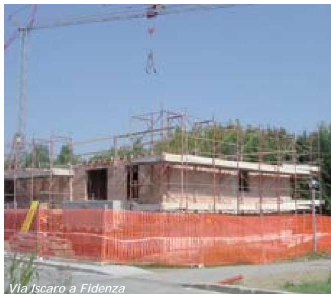
Via Iscaro a Fidenza

Sempre da parte della cooperativa Casa del lavoratore, sono in corso i lavori per la costruzione di 6 appartamenti (tre dei quali assistiti da contributo regionale per coppie di giovani): l'intervento è collocato in Via Iscaro a Fidenza ed ha un particolare valore sociale, trattandosi di edilizia a prezzo convenzionato, destinata a soddisfare le esigenze di chi è giovane e vede realizzarsi così il sogno della prima casa.