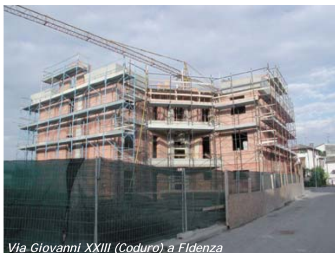
Via Giovanni XXIII (Coduro) a Fidenza

Sempre a Fidenza, in Via Giovanni XXIII (Coduro), Polis s.p.a. sta proseguendo la costruzione di 9 alloggi, in una palazzina che viene a completare il Comparto C10; nella seconda metà dell'anno prossimo è prevista la consegna.